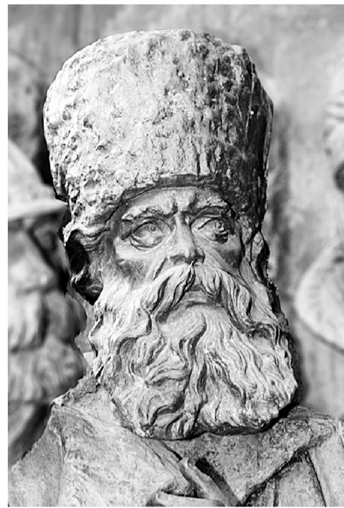
тему «Роль князя Воротынского в истории России».

Среди многочисленных гостей на торжества в Воротынк приезжают гости из города – побратима Воротынец Нижегородской области и краеведы по истории Кирилло-Белозерского монастыря, в котором находится родовая усыпальница Воротынских. На протяжении 20 лет велась разносторонняя работа: издавались исторические буклеты; проводились памятные мероприятия (фотовыставки, встречи с писателями, поэтами и интересными людьми, экскурсии, уроки и внеклассные мероприятия в школах, занятия в детских садах и библиотеках); создан фильм «Древний Воротынк. Времена и судьбы»; установлена тесная связь с «Кирилло-Белозерским музеем-заповедником»; неоднократно были выступления в различных СМИ Калужской области на